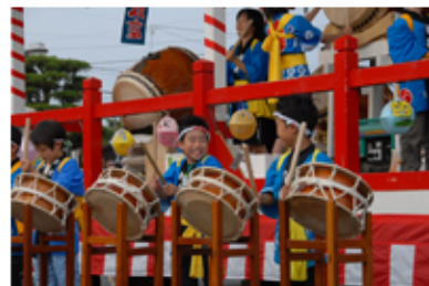
八雲ばやしどどん鼓座