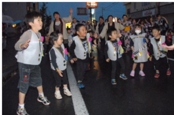
マリア幼稚園の園児たち