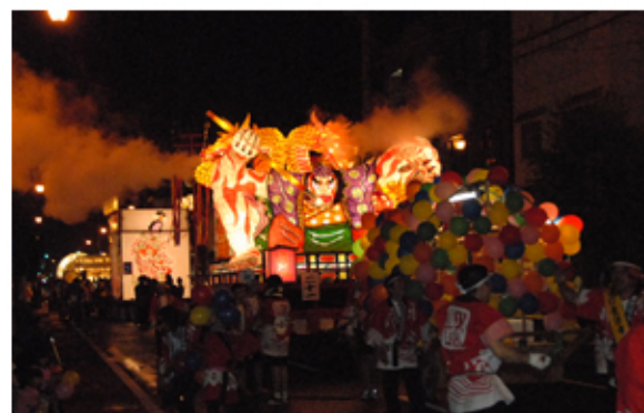
大賞受賞の東町倭天神