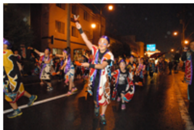
平成寺子屋囃子実行委員会