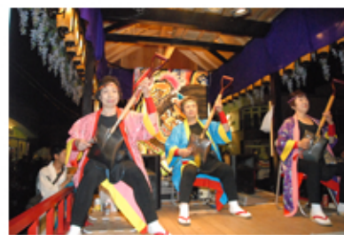
熊石レディスネットワークのメンバーによるスコップ三味線