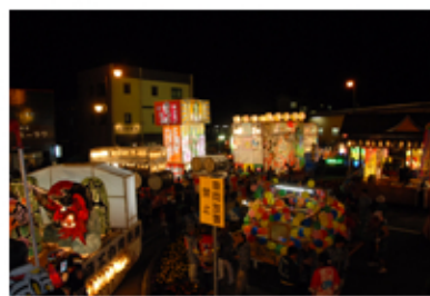
フィナーレの様子