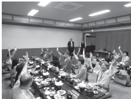
モニターツアー参加の皆さん

参加者の皆様からは「自然が美しい」「施設が整備されていて驚いた」「食べ物がかく美味しい」と大変な好評をいただき、八雲町のまちづくりに関する貴重な提案もいただくことができました。