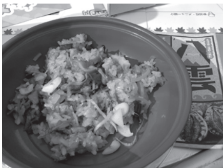
八雲高校生による「ふた海おこわ」

10月6日(日)、札幌市において「高校生チャレンジグルメコンテスト」HOKKAIDO」が開催され、八雲高校総合ビジネス科の生徒が準優勝に輝きました。