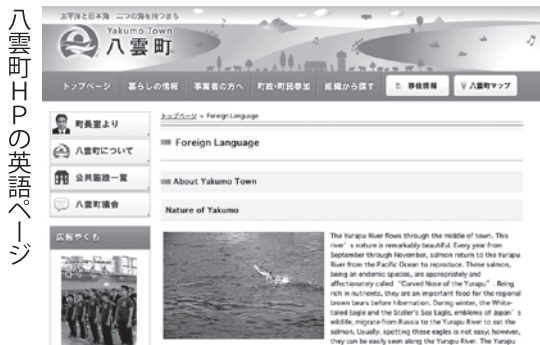
八雲町HPの英語ページ