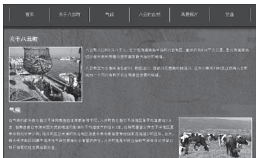
八雲観光物産協会HPの中国語ページ