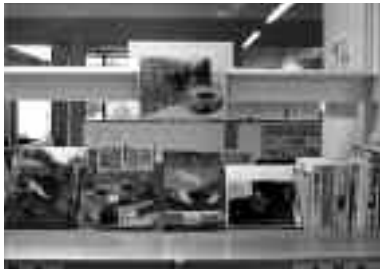
「北海道の鉄道」に関する本を展示しています。