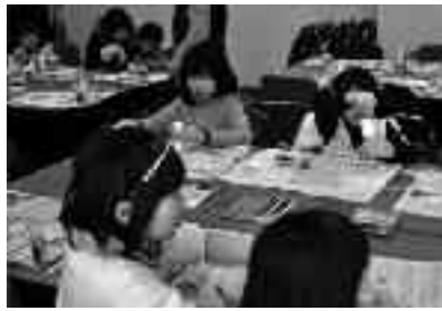
おたのしみこうさく会の様子