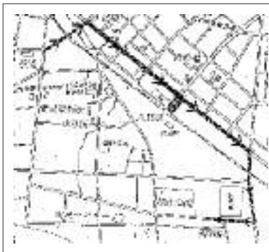
運行コース図 2日目 7月4日(土) 出発式午後6時30分 《役場》

今年で33回目を迎える北海道三大あんどん祭りの一つ「八雲山車行列」(同実行委員会主催)は、7月3日(金)・4日(土)に行われ、今年は開町10年記念として熊石地域の山車が4台参加し、あわせて約30台の山車が別図のコースを練り歩く予定です。 ※雨天の場合は5日(日)まで順延します。 また、八雲町観光大使の伊