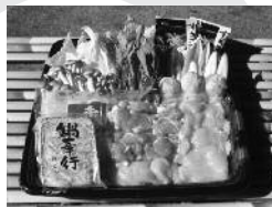
名古屋コーチンひきずりセット

http://www.furusato-tax.jp/japan/prefecture/23219