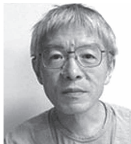
心臓血管内科部長