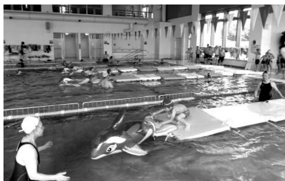
7月16日 夏のプール祭り