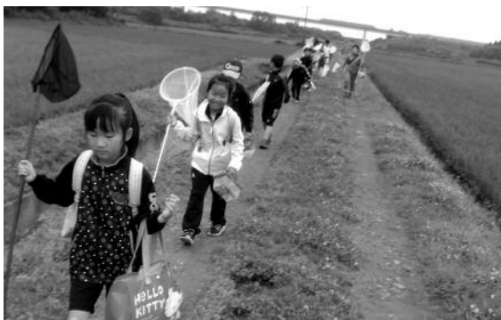
7月17日落部スポーツクラブ実施 児童が落部川までウォーキング