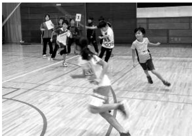
第10回町民スポーツ フェスティバル (昨年の様子)