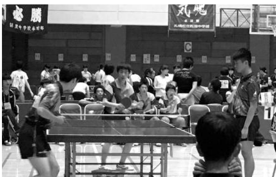
7月29日～31日 北海道中学校卓球大会