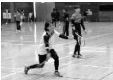
第16回全道スポンジテニス大会(昨年の様子)