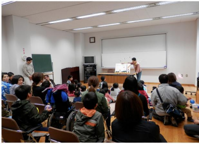
「青空図書館」の様子 5月19日(土)