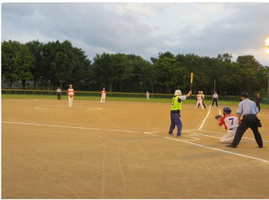
第13回町民ソフトボール大会(決勝戦 東分団vs自衛隊)