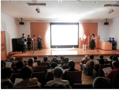
「図書館フェスティバル」の様子 (10月6日開催)