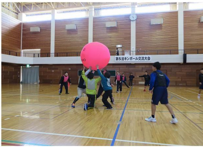
第5回 キンボール交流大会

【各事業の申し込みは総合体育館まで】 ■八雲町総合体育館 ☎0137-62-2141 【開館時間】 午前9時30分～午後9時 ※日曜日・祝日は午後5時まで 【休館日】 月曜日、年末年始 ※月曜日が祝祭日の場合は、祝祭日明けの平日が休館日となります。 ■熊石教育事務所 ☎01398-2-3111