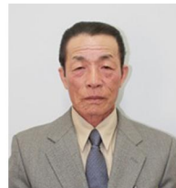
瑞宝単光章(消防功労)