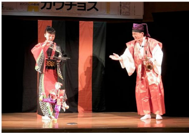
「大道芸&人形劇公演の様子」 6月29日(土)