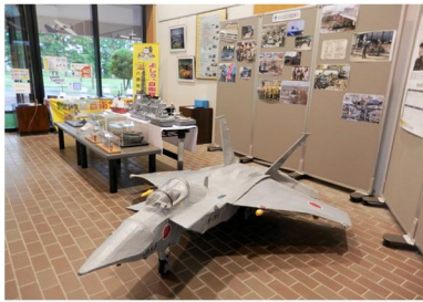
「自衛隊を知って展」の様子 7月2日(木)～12日(日)