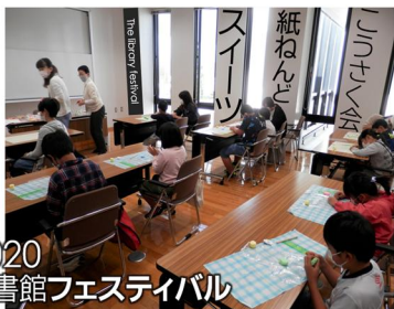
2020 図書館フェスティバル