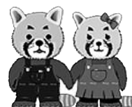
函館人権マスコット ユウちゃん マイちゃん

私たちは、こうした人間の性の多様性について理解を深め、これらを理由とする偏見や差別をなくしていかなければなりません！