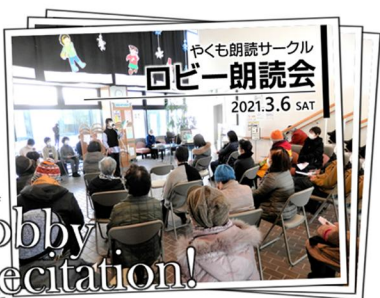
「ロビー朗読会」の様子 3月6日(土)開催