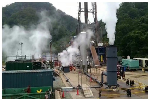
仮噴気試験の様子(鉛川地区)

しかし、どちらの地区の掘削調査も、発電にはつながっておらず、地熱発電事業の難しさが分かります。