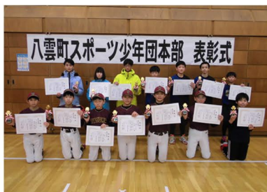
令和4年度 八雲町スポーツ少年団本部 表彰式の様子

【各事業の申し込みは総合体育館まで】 ■八雲町総合体育館 ☎0137-62-2141 【開館時間】 午前9時30分～午後9時 ※日曜日・祝日は午後5時まで 【休館日】 月曜日、年末年始 ※月曜日が祝祭日の場合は、祝祭日明けの平日が休館日となります。 ■熊石教育事務所 ☎01398-2-3111