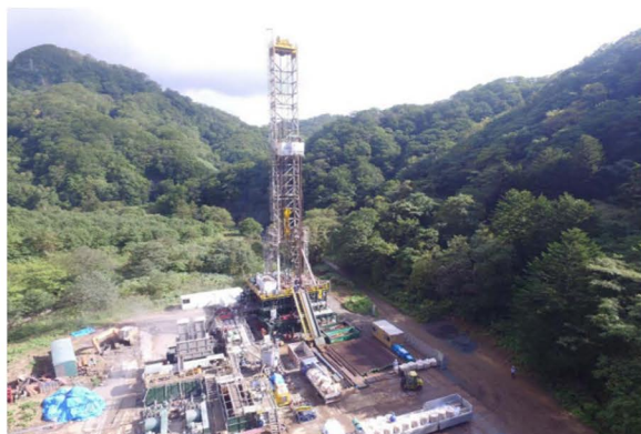
掘削調査の様子(鉛川地区)

実際に八雲町においても、過去に鉛川地区と熊石地区でJOGMECの支援を活用した事業者により掘削調査が実施されています。