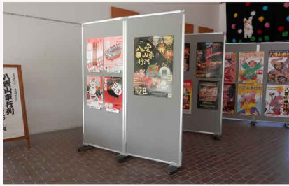
「八雲山車行列ポスター展」の様子