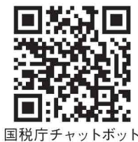
国税庁チャットボット

「チャット」と「ロボット」を組み合わせた言葉で、質問したい内容をメニューから選択するか、自由に文字で入力すると、AI(人工知能)を活用して、自動で回答するウェブサービスです。