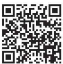
普及指導員 なったらいいっしょ