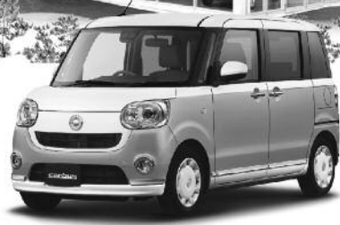
canbus ムーヴキャンバス