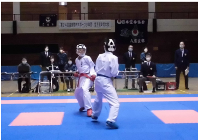
第24回 渡島管内スポーツ少年団 空手道交流大会 (昨年度の様子)

【各事業の申し込みは総合体育館まで】 ■八雲町総合体育館 ☎0137-62-2141 【開館時間】 午前9時30分～午後9時 ※日曜日・祝日は午後5時まで 【休館日】 月曜日、年末年始 ※月曜日が祝祭日の場合は、祝祭日明けの平日が休館日となります。 ■熊石教育事務所 ☎01398-2-3111