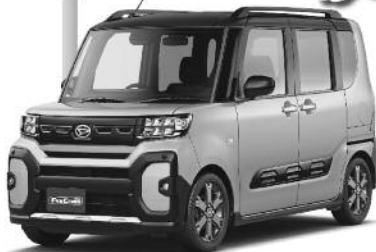
FunCross タントファンクロス