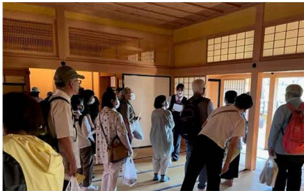
「第47回文学史跡めぐり」の様子