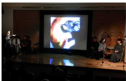
「第12回幻灯朗読会」の様子