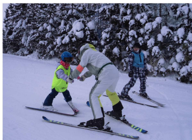
親子ふれあいスキー教室 (昨年度の様子)