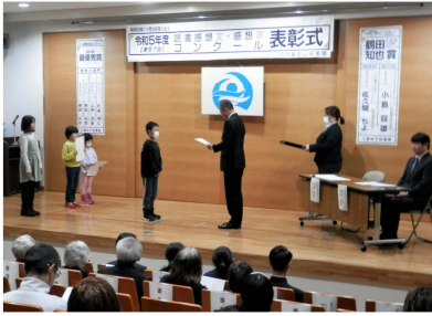
「読書感想文・感想画 コンクール表彰式」の 様子