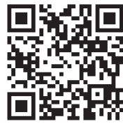
地方税 ポータルシステム

⑤ 町内で事業をされている方には、12月下旬に申告書を送付しています。同封の「償却資産申告の手引き」をご覧のうえ作成ください。また、事業をされている方で申告書が届いていない方は、問い合わせください。