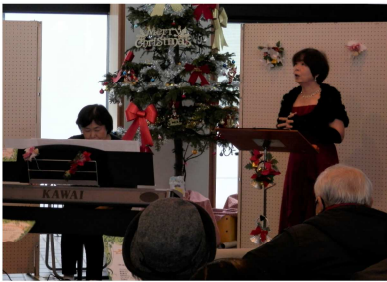
「クリスマスコンサート」の様子