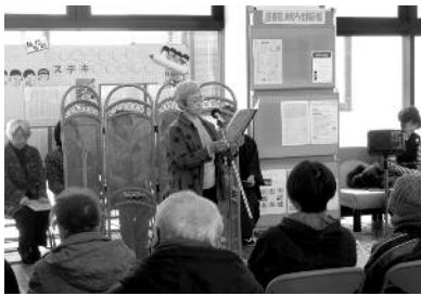
3月2日開催 「ロビー朗読会」の様子