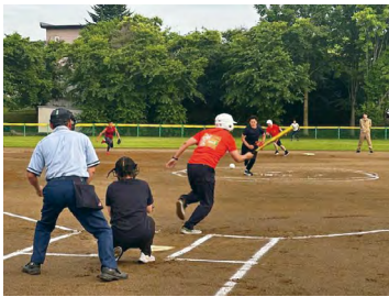
第19回町民ソフトボール大会の様子