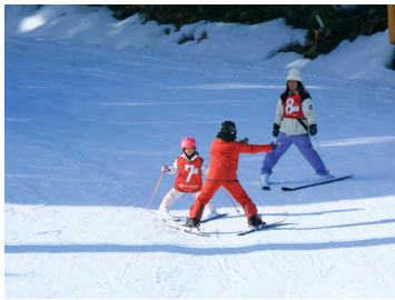
親子ふれあいスキー教室 (昨年度の様子)