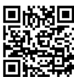
KSI 官公庁 オークション

インターネット公売に参加する方は、参加申込受付期間中にKSI官公庁オークション内の当機構ページで参加申込手続きを行い、その後、入札期間内に入札をしてください。