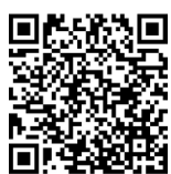
「賃上げ」支援助成金 パッケージ