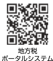
地方税 ポータルシステム

⑤ 町内で事業をされている方を対象に12月下旬に申告書を送付します。同封の「償却資産申告の手引き」をご覧ください。また、事業をされている方で申告書が届いていない方は、左記まで問い合わせください。