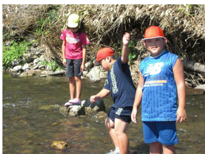
← 砂蘭部川河川敷で水遊び。(3年生)

平成25年度末の閉校を見据えて、現3年生と4年生と、八雲小学校との交流を行っています。9月7日(金)には、本校3年生の児童2名が八雲小学校へ行き、「秋の遠足」に参加してきました。残暑厳しい一日、2人とも元気いっぱい、八雲小の子どもたちと楽しんできました。また、21日(金)には、4年生の児童1名が社会科のバス学習で八雲小の子どもたちと函館まで社会見学に行きました。