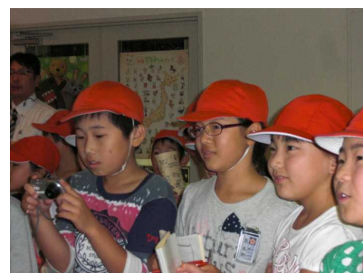
NHK函館放送局 → 見学。(4年生)