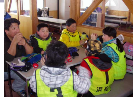
グループごとに 楽しくお弁当を。