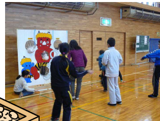
鬼に向かって元気に 「鬼は外！福は内！」