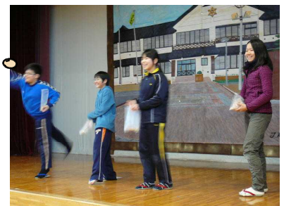
今年の年男、年女のみなさん

1月に行われた「八雲町新年席書大会」にたくさんの児童が参加し、たくさんの賞をいただきました。今回も「青少年健全育成書道展」が行われ、特別賞を含め、優秀な成績を収めました。今回賞に入った4名の児童、そして残念ながら賞をもらえなかった児童たちもすばらしい作品です。レベルの高さがうかがえます。