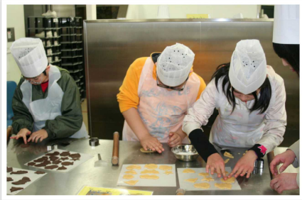
白い恋人パークでクッキー作り

6年生の皆さん、この思い出と仲間を大切に、残りの小学校生活を充実したものにしてください。