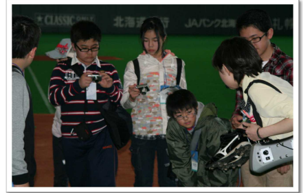
札幌ドームでしばし選手気分