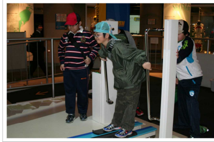
ウインターミュージアムでの体験