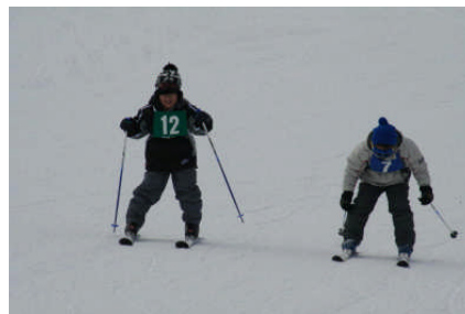
去年より格段の進歩