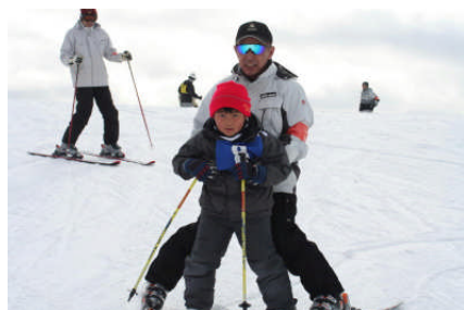
初めての山頂からの滑走