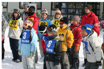
これからスキー教室をはじめま～す

2月4日(金)のスキー遠足で学校のスキー活動は終了しますが、今年は雪が豊富にありますので春日スキー場なども大いに活用しながら来年の滑りにつなげてほしいと思います。