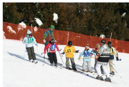
Bグループには校長先生も